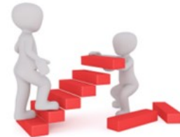
GO pour le Campus Grand Paris