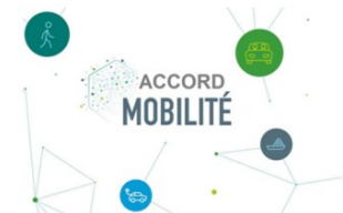
Location Longue Durée Vélos