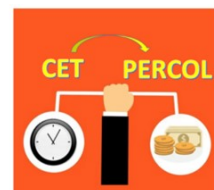
Placement jours de CET sur le PERCOL