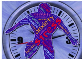
Salariés en difficulté