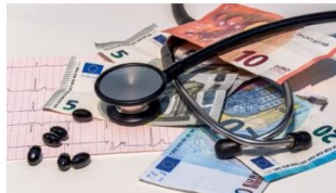
Contrat santé IPECA prévoyance