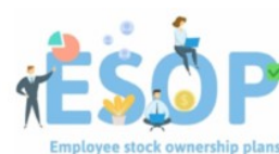
ESOP 2025 : c'est parti !