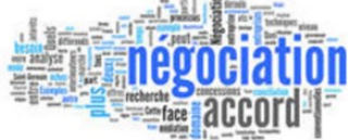
RCC : Compétitivité