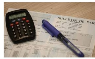
Complément Annuel de Rémunération