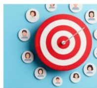
Bonus cadre, Harmonisation oui, mais