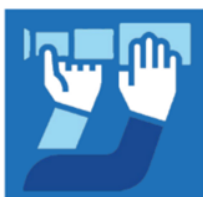
Les Essentiels du mois