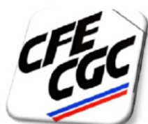
Mobilisation du 18 septembre