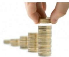
Epargne salariale 2025