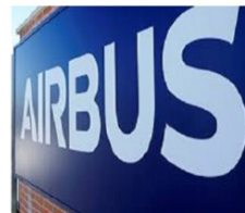
Conseil de surveillance ESOP / AG actionnaires AIRBUS