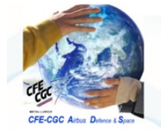
Fusion Airbus DS / Thales Alenia Space