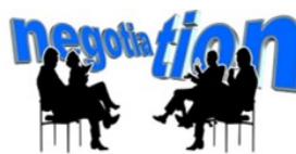
RCC : Compétitivité