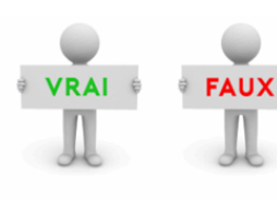
Proton, RCC, accords