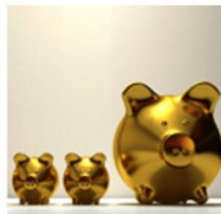
Intéressement 2024 : 1378€