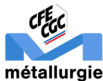
La CFE-CGC Métallurgie ne signe pas la revalorisation des SMH