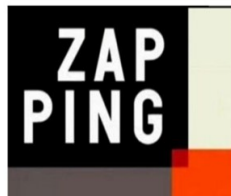
Zapping CFE-CGC ADS